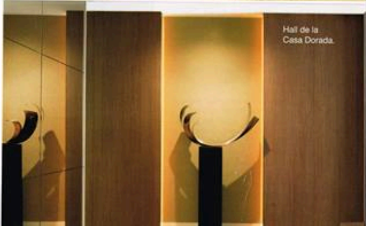
Hall de la Casa Dorada.