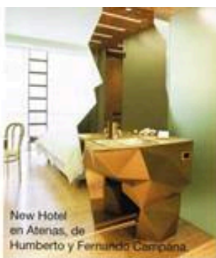
New Hotel en Atenas, de Humberto y Fernando Campaña.

encuentro inspiración en muchos elementos del día a día.