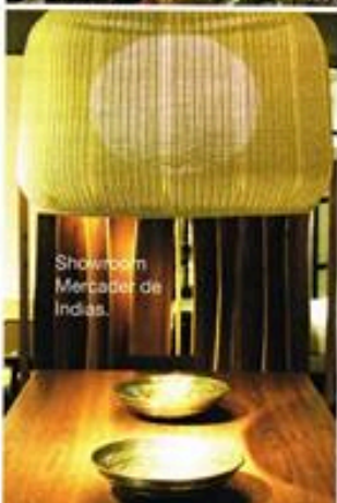
Showroom Mercader de Indias.