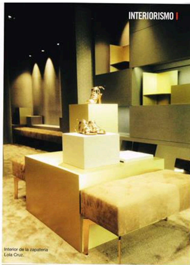
Interior de la zapatería Lola Cruz.

MERCADER DE INDIAS Tiquigráfico Martí, 3 Tel 962 910 491