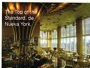
The Top of the Standard, de Nueva York.

¿ En qué te inspiras? Viajar es sin duda una de mis mejores inspiraciones. Disfruto muchísimo visitando hoteles de diseño, restaurantes o locales comerciales de los que siempre aprendo algo. Pero también